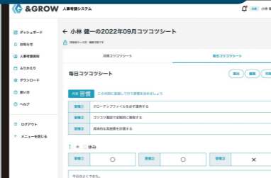
毎日コツコツシート画面