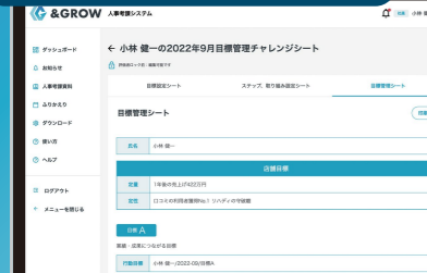
目標管理シート画面